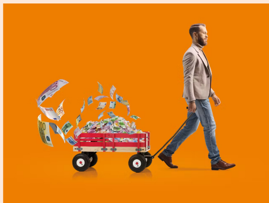
Mensen vergelijken soms domweg dat ze bij een andere bank meer rente krijgen.

'Ons brein is veel gevoeliger voor een beloning die we snel kunnen krijgen dan voor een beloning die in de toekomst ligt', zegt Walter Limpens, oprichter van Neurensics, een marktonderzoeksbureau gespecialiseerd in het consumentenbrein. 'Extra rente is een beloning in de toekomst. Het levert niet meteen iets op.' Hij vertelt over proefpersonen die konden kiezen tussen vandaag een cadeaubon van €20 of over twee weken een cadeaubon van €30.